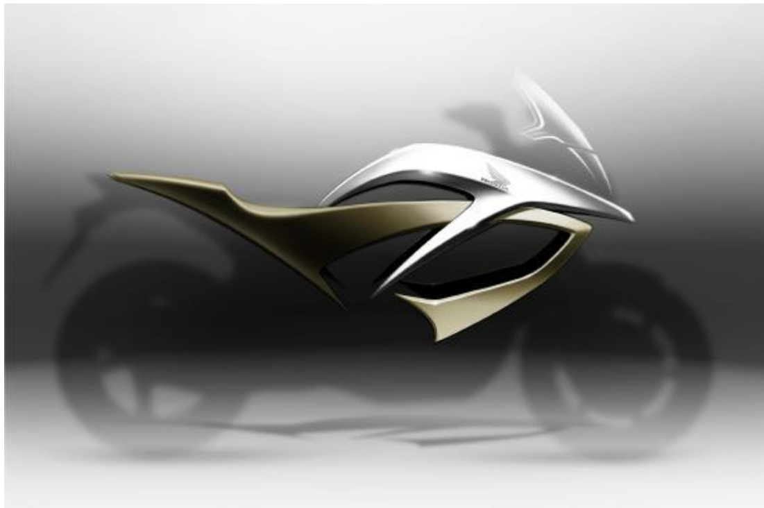
Bild 1: Das neue Crossover-Konzept von Honda kombiniert die praktische Vielseitigkeit und Dynamik eines Performance-Naked-Bikes mit der entspannt aufrechten Sitzposition und dem robusten Auftritt eines Adventure-Bikes.

Honda lässt für das kommende Modelljahr ein aufregend neues „Crossover“-Konzept Realität werden. Die Maschine wird die besten Aspekte von zwei unterschiedlichen Fahrzeug-Kategorien vereinen. Kombiniert werden die praktische Vielseitigkeit und Dynamik eines Performance-Naked-Bikes mit der entspannt aufrechten Sitzposition und dem robusten Auftritt eines Adventure-Bikes.